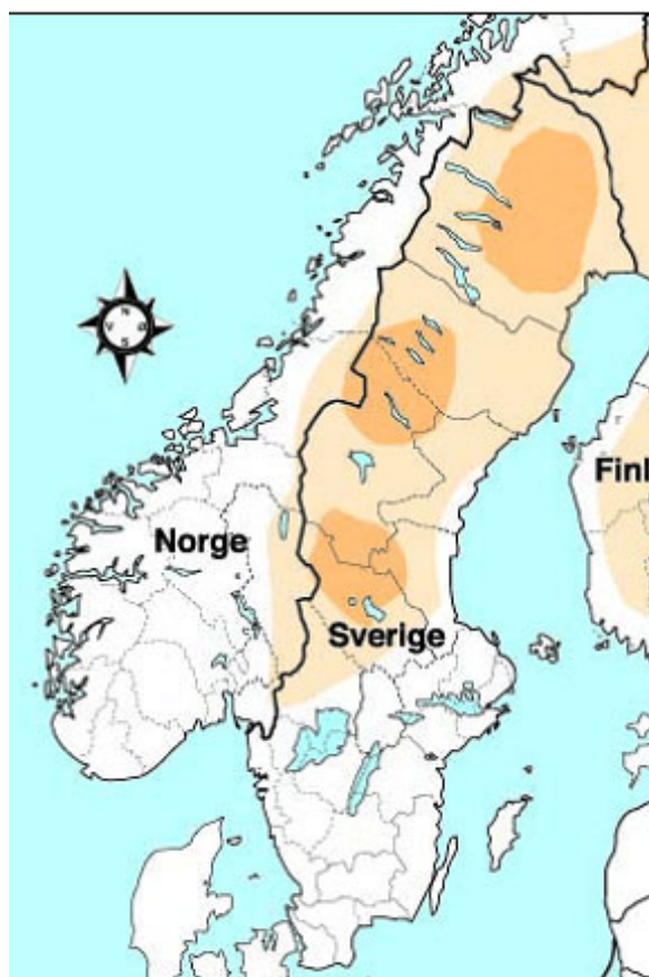
Figur 2. Brunbjørnens utbredelse i Skandinavia (lyst brun), med konsentrasjonsområder for yngling (mørkt brun).

[Lande, et al. 2003, Katajisto et al. manus]